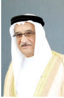
رئيس المجلس الأعلى للصحة.

لمرض نقص المناعة المكتسبة سيكون محط أنظار العديد من دول العالم، وخصوصاً أنه سيشهد حضور خبراء ومختصين في مجال مكافحة وتشخيص وعلاج المرض، وسيخرج بالعديد من الأهداف والتوصيات والاستفادة الكاملة للمشاركين والتي سيكون لها آثار طبية مميزة في المستقبل. وأشاد بجهود اللجنة الوطنية لمكافحة نقص المناعة المكتسبة وشركة أديوكيشن بلاس في سبيل الاستعداد المبكر لتنظيم المؤتمر، متمنياً للجميع كل التوفيق والنجاح.