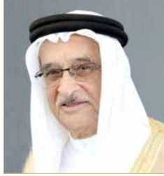
الشيخ محمد بن عبدالله

الشيخ محمد بن عبدالله آل خليفة أن مؤتمر البحرين الدولي الأول لمرض نقص المناعة المكتسبة سيكون محط أنظار العديد من دول العالم خصوصاً أنها سيشهد حضور خبراء ومختصين في مجال مكافحة وتشخيص وعلاج المرض، وسيخرج بالعديد من الأهداف والتوصيات والاستفادة الكاملة للمشاركين والتي سيكون لها آثار طبية مميزة في المستقبل. وأشاد بجهود اللجنة الوطنية لمكافحة نقص المناعة المكتسبة وشركة أديوكيشن بلاس في سبيل الاستعداد المبكر لتنظيم المؤتمر، متمنياً للجميع كل التوفيق والنجاح.