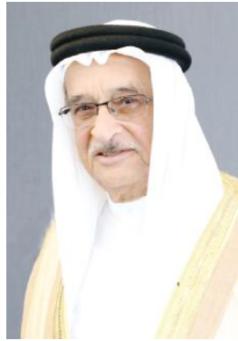
الشيخ محمد بن عبدالله آل خليفة

أكد رئيس المجلس الأعلى للصحة الفريق طيبب الشيخ محمد بن عبدالله آل خليفة أن تنظيم البحرين مؤتمر البحرين الدولي الأول لمرض نقص المناعة المكتسبة الذي سيعقد يومي 22 و23 سبتمبر 2022 يجسد مكانة المملكة في التطور الطبي ومبادراتها الرائدة في مواصلة ارتقاء هذا القطاع المهم الذي يحظى بمتابعة ودعم