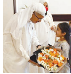
○ رئيس المجلس الأعلى للصحة خلال الفعالية الرمضانية التي نظمتها جمعية السكري البحرينية.